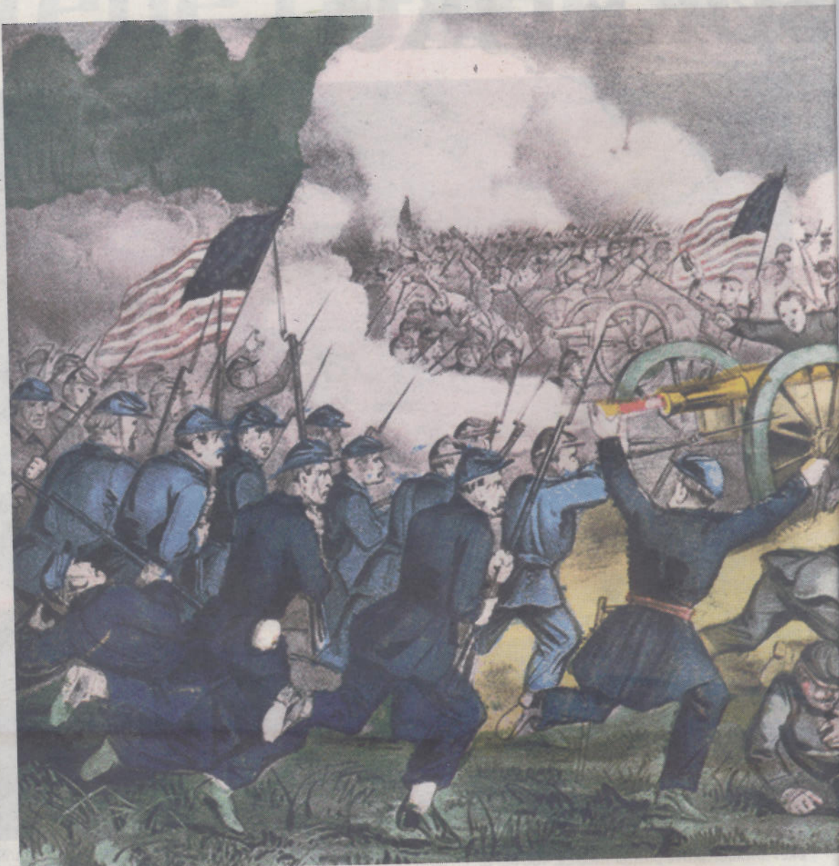
Krigens blodigste slag: Slaget ved Gettysburg ble utkjempet 1.-3. juli 1863, og ble det blodigste slaget under den amerikanske borgerkrigen. Tilsammen ble 51000 soldater drept eller skadd i det som i ettertid er blitt sett på som et vedepunkt i borgerkrigen.